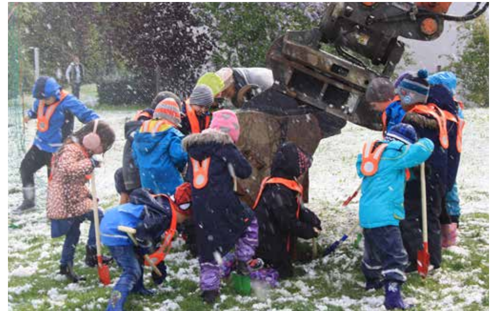
Die Kindergärtler aus dem Oberschulhaus helfen im Schneetreiben beim Spatenstich für ihr neues Schulhaus im Grund

15. bis 19. Mai Projektwoche im Schulpavillon