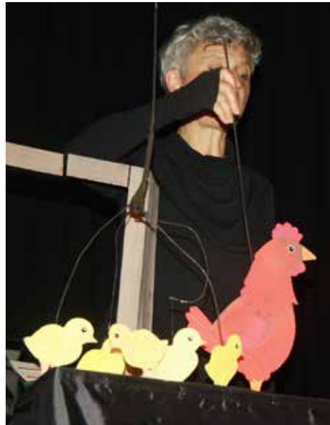
Das Figurentheater «Couleurs d'ombre» hat allerlei Gefiedertes mitgebracht