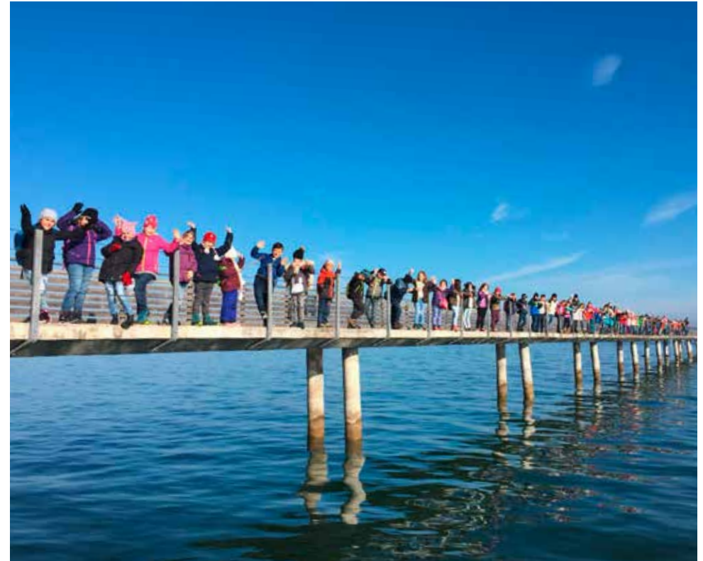
Die Klassen des Unterschulhauses machen auf ihrer Herbstwanderung Halt auf dem Steg in Altnau