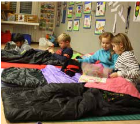
Lesenacht im Schulpavillon: Die Ältesten dürfen sogar im Schulzimmer übernachten

diverse Auftritte und andere Adventsaktivitäten einzelner Klassen und ganzer Schulhäuser