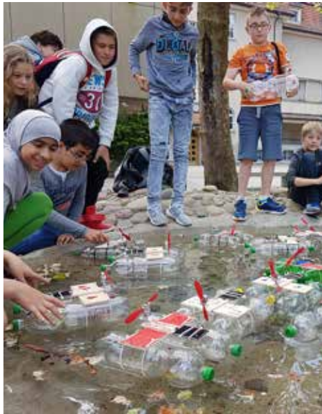
Die Zelgli Recycling-Boote im Stossverkehr

16. Juni Wettkampf «Schnellster Pavillönler» im Schulpavillon