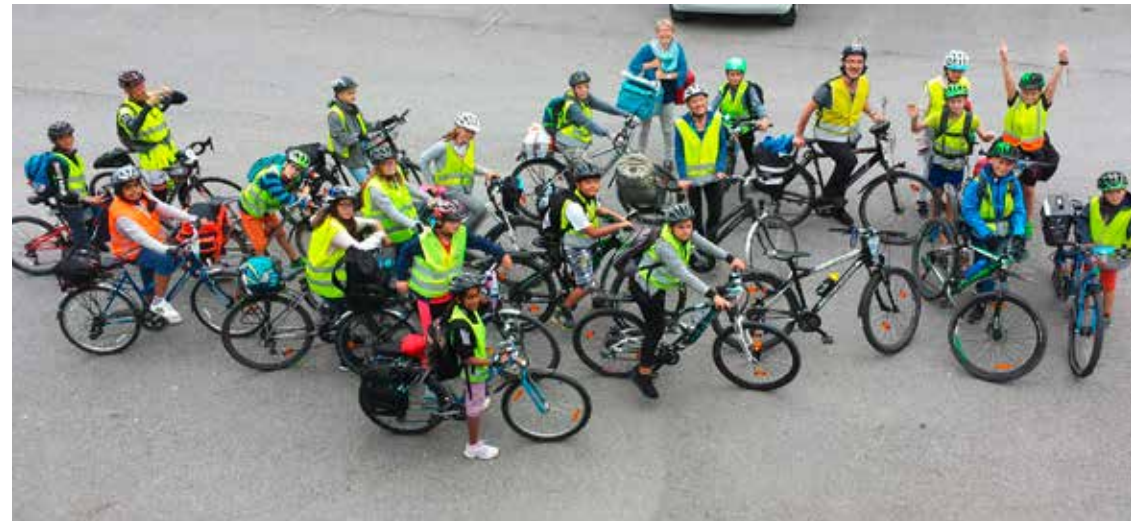
Klasse Scheuner abfahrbereit für die Tour um den Bodensee

4. bis 8. September Klassenlager 6. Klasse Scheuner mit den Velos rund um den Bodensee