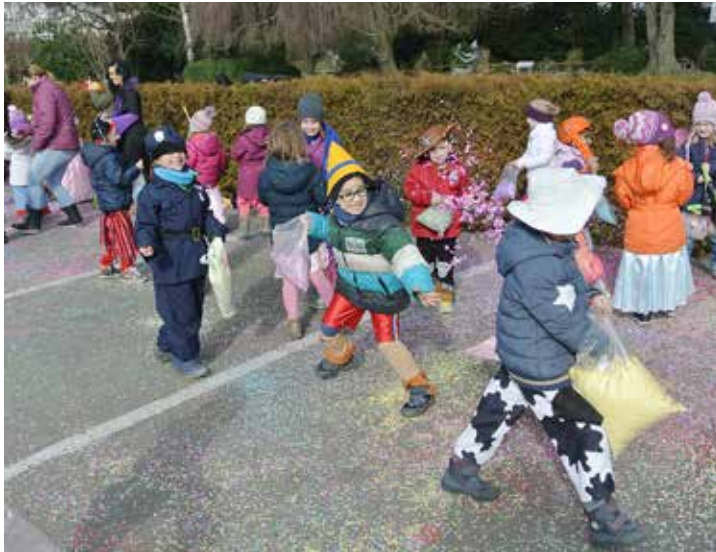
Fasnachtszeit: Die Kindergärtler bei ihrer traditionellen Konfettischlacht am See...