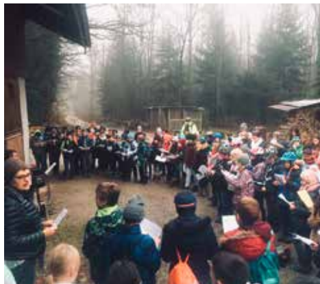
Die Pestalozzi-Klassen beim Forsthof, wo sie sich nach einem adventlichen Sternmarsch alle trafen