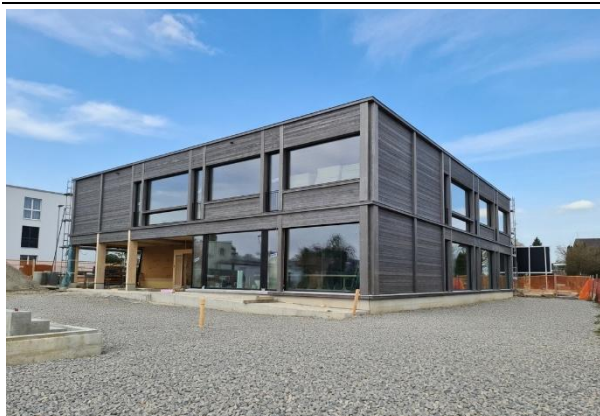
Das neue Schulhaus Brüggli ist bald bezugsbereit