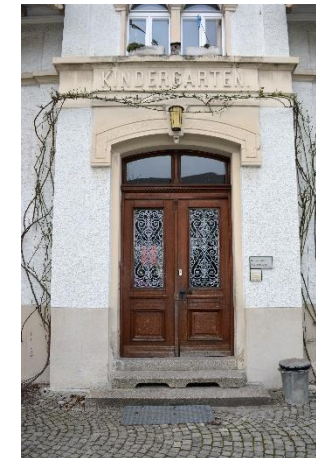
Kastanienbaum (1) S. Giselbrecht/ M. Schwinger