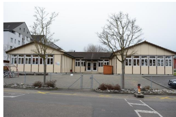
Pavillon: A. Fischer