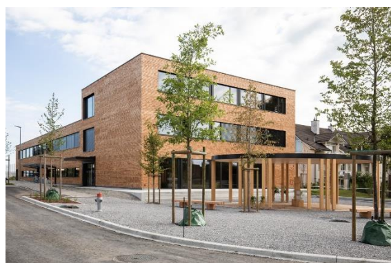
Schulhaus im Grund Y. Michaud