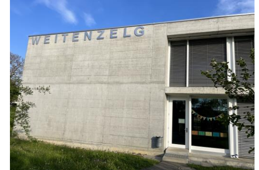
Weitenzelg (1) B. Nogueira