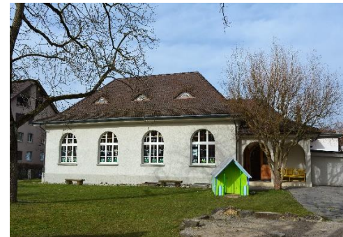
Spielhalle (1) E. Loppacher/I. Vogt