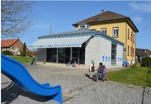
Holzstein (2) V. Esposito S. Hirschi