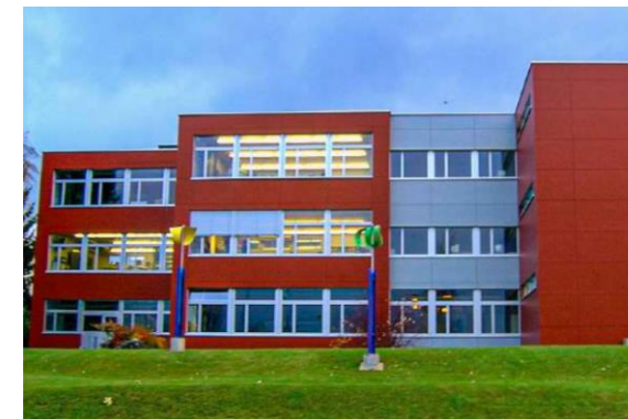
Reckholdern: A. Trüb/R. Murbach