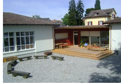
Sonnenwinkel (2) O. Renner A. Ramsauer