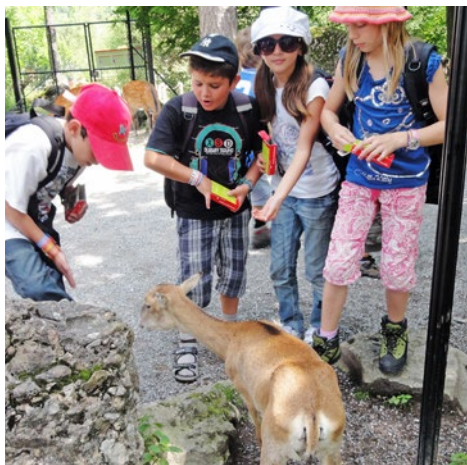
Füttern eines zutraulichen Rehs