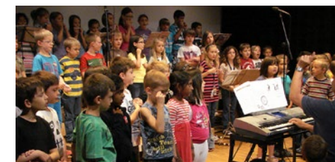
Sommerkonzert mit fast hundert Schülern auf der Aulabühne