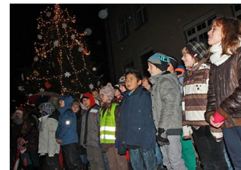
Adventssingen unter dem grossen Pestalozzi-Weihnachtsbaum

Gerade an zwei Orten ertönten an diesem Abend weihnachtliche Klänge: Die Unterstufenschüler vom Unterschulhaus füllten die Alte Kirche mit Advents- und Weihnachtsliedern und erfreuten die Gäste damit. Die Mittelstufenschüler der beiden Pestalozzischulhäuser trafen sich derweilen beim grossen Weihnachtsbaum auf ihrem Schulreal und liessen dort weihnachtliche Weisen erklingen – und freuten sich anschliessend, dass es etwas Warmes zu trinken gab.