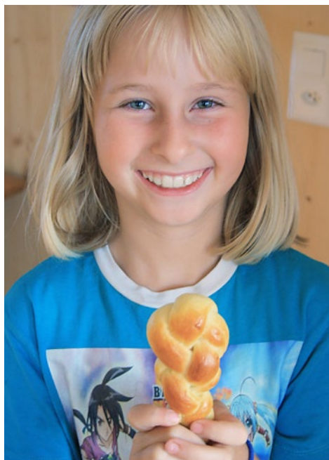
Selber gebackener Butterzopf ist eine Freude

Im Mittelpunkt dieser vier Lagertage stand das Thema «Ernährung»: Die Kinder waren in sogenannte «Kochgruppen» und «Backgruppen» eingeteilt und beteiligten sich so an der Zubereitung von einem bis zwei Menüs. Drei bis vier andere Kinder legten täglich Hand an, das nötige Brot vom Mehl zum Teig und dann zum fertigen Produkt herzustellen. Weiter stellten die Schüler selber Konfitüre, Käse, Butter und Joghurt her.