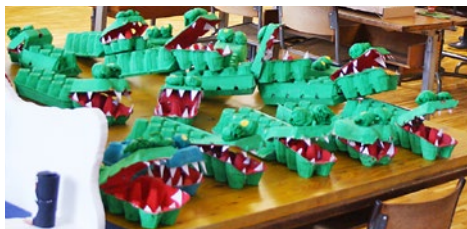
Diese Krokodile waren einmal Eierkartons

Schon vor dieser Projektwoche war das Sammelfieber im Unterschulhaus ausgebrochen: Die Kinder der fünf Unterstufenklassen haben dann gelernt, das Abfallmaterial richtig zu sortieren und dann auch zu kreativen und bunten Gegenständen zusammenzufügen. Die Eltern und Verwandten hatten am Freitagabend Gelegenheit, diese Arbeiten zu bewundern. Gleichzeitig waren auf dem Pausenplatz ein Parcours mit Geschicklichkeitsspielen und Verpflegungsstände aufgebaut worden. Und schliesslich kamen die zahlreichen Gäste in den Genuss eines sommerlichen Konzerts.