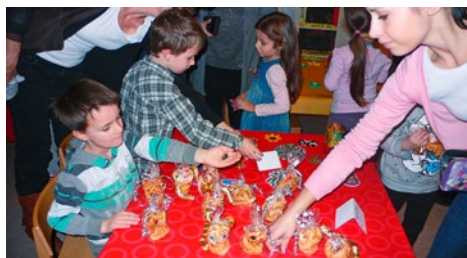
Hier werden feine Apfelringli verkauft