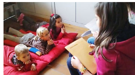
Ist das spannend, wenn Sechstklässlerinnen vorlesen!