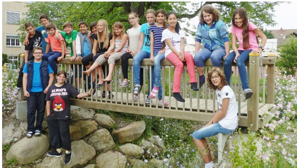
So sehen Schüler beim Übergang von der Primar- zur Sekundarschule aus: die Klasse Ruoff am letzten Tag der Primarschulzeit

– noch etwas Geld in der Kasse und einen gewonnenen SBB-Gutschein hat (siehe 7. Mai). So konnte sich die Klasse nebst einem Besuch des Technoramas in der zweitletzten Schulwoche eine veritable Abschiedsparty mit Elterndankesapéro, Disco, Übernachtung, gemeinsamem Frühstück und abschliessendem Bowling leisten.