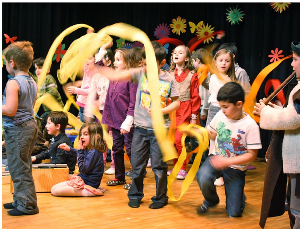
Erfolgreiche Premiere der Grundmusikklassen