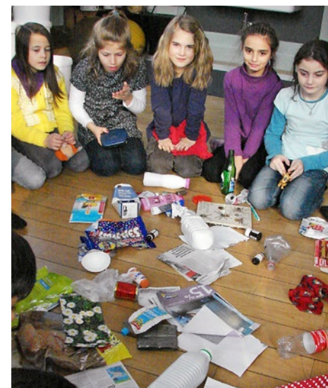
Abfälle trennen will gelernt sein!

Was wie schlechter Unterricht tönt, ist in der Realität vielmehr guter Unterricht zu teilweise schlechten Angewohnheiten unserer Gesellschaft: Vertreter von «pusch» (praktischer Umweltschutz Schweiz) besuchen Schulklassen und lehren die Schülerinnen und Schüler, dass sich Abfälle zu trennen fürs Portemonnaie und für die Umwelt lohnt. Den Kindern wird auf spielerische Weise vermittelt, dass Alu, Batterien, Grünabfälle und PET-Flaschen nicht in den Müllsack gehören – und sie lernen anhand des PET-Flaschen-Kreislaufs, dass aus Alt wieder Neu werden kann.