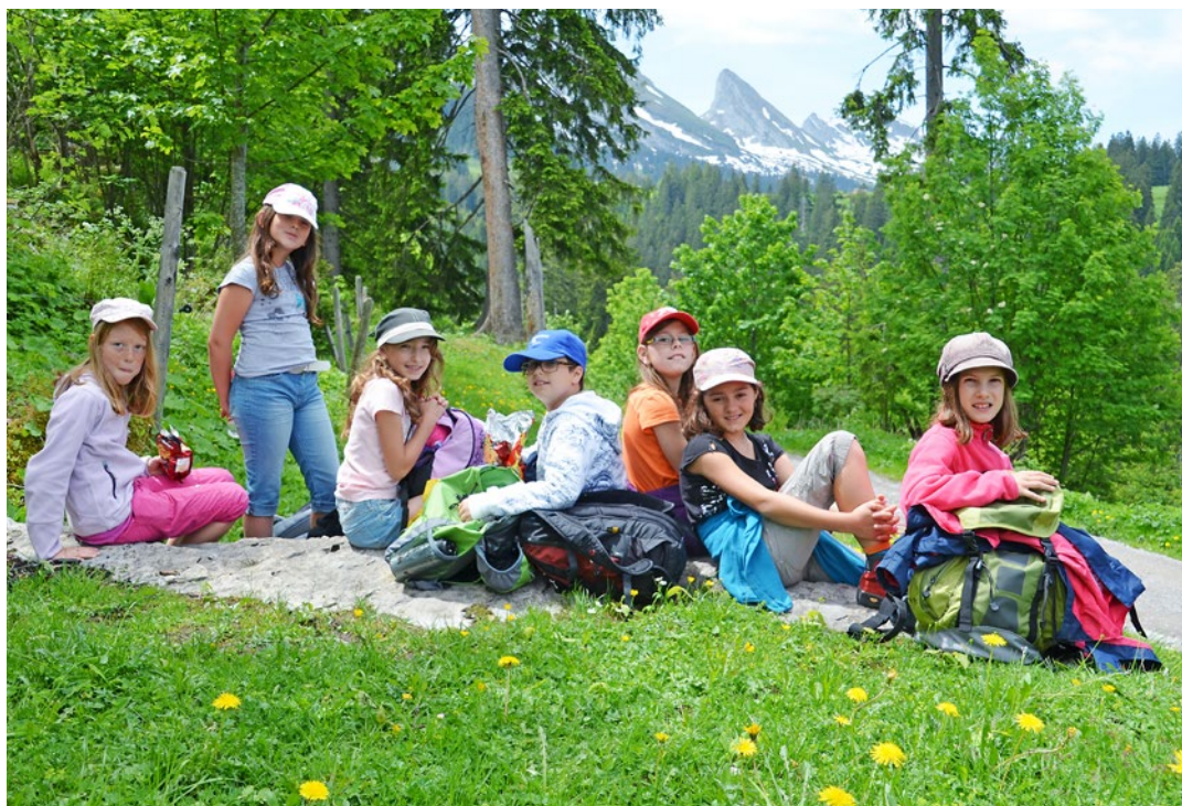
Rast auf dem Weg an die Thur-Wasserfälle

Während dieser vier Lagertage waren die Eltern daheim jederzeit auf dem Laufenden über das La-