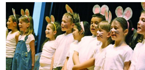
Der Mäusechor aus dem Oberschulhaus

Dialoge, Lieder und die musikalischen Begleitungen gefielen den zahlreichen Eltern, Geschwistern und Freunden.