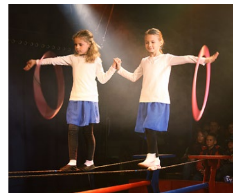
Diese Zirkusartisten waren spitze!

Während vier Tagen haben die Schülerinnen und Schüler der beiden Klassen im Spitz unter der Federführung der Leute vom Zirkus Bengalo ein anderthalbstündiges Programm einstudiert. Am Don-