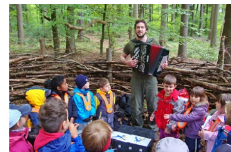
Der WWF kann auch singen!

Im Mai fand ein solcher Erlebnistag im Wald statt – zusammen mit einem Kinder-Beauftragten des WWF. Er zeigte den Kindergärtlern viel Interessantes rund um den Wald und seine Tiere – und sang mit ihnen das Lied von Krax dem Raben, welcher sich für die Umwelt einsetzt.