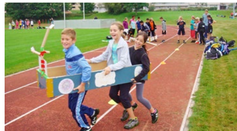
Im Dreierbob unterwegs

Beim zweiten Anlauf war schönes Wetter – und der Sporttag für alle Mittelstufenklassen konnte stattfinden. Viel Zuschauer fand das traditionelle Fussballspiel «Schüler gegen Lehrer» – bei welchem einmal mehr die ältere Generation die Oberhand behielt.