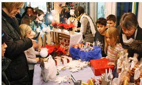
Adventsmarkt im Pavillon: Schön präsentiert ist halb verkauft!

In den vorangehenden Wochen haben die 80 Kinder des Pavillonschulhauses ihre Werk- und Zeichnungsstunden für einen besonderen Zweck verwendet: Sie haben Tontöpfli, Engel, Samichläuse, Gipssterne und Blumenstecker gebastelt und sie haben gebrannte Mandeln und Konfitüre selber hergestellt. Am Adventsmarkt an einem Freitagabend wurden dann all diese Gegenstände in den