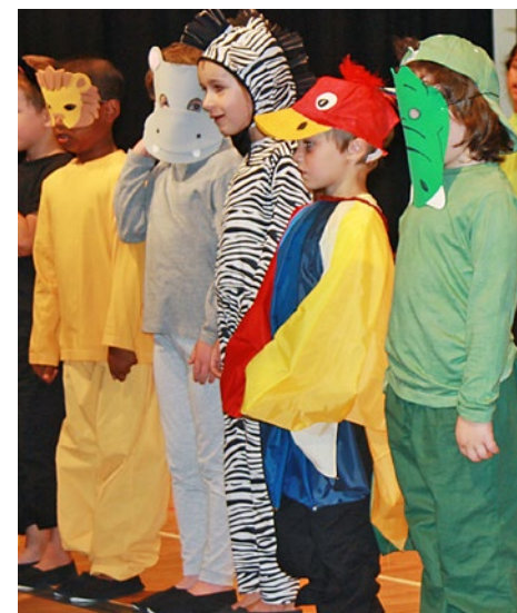
Die farbenfrohe Tierschar