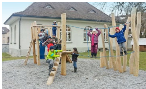
Auf dem neuen Spielplatz beim Kindergarten Spielhalle geht es hoch zu

Nebst der Planung der beiden Teilsanierungen Pestalozzischulhaus und Rebsamenplatz beschäftigte sich die Baukommission mit kleineren Sanierungen und Umbauten: Der Kindergarten Kastanienbaum wurde einer Innensanierung unterzogen; auf dem Pestalozziareal wurden parallel zur Sanierung der Florastrasse Kanalisations- und Belagsarbeiten ausgeführt; und schliesslich erfolgte der Start zur Aufwertung der Spielplätze bei den Kindergärten, welche in den kommenden Jahren weitergeführt werden soll.