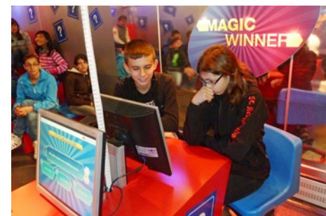
Beim Wissenstest im Schulzug

Und da man nun schon mal gratis in St. Gallen war, fand am Nachmittag ein Maibummel in und um St. Gallen statt – mit den Stationen Botanischer Garten und Wildpark Peter und Paul.