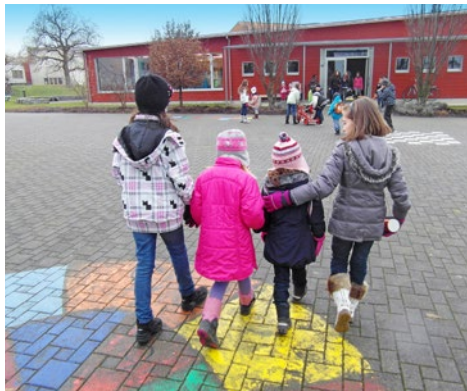
Zwei Kindergärtnerinnen unterwegs mit ihren grossen Patinnen vom Zelglischulhaus

Rund hundert Schülerinnen und Schüler aus 14 Nationen gehen in unserem Schulhaus ein und aus. Da man einander rasch kennt, geht es auf dem Pausenplatz meist friedlich zu und her. Beim Fussball-Match mit der Unterstufe vom Pavillon ist häufig Hauswart Tobler mit von der Partie, was die Kinder natürlich besonders anspricht.