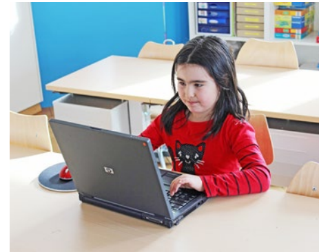
Die Schülerin ist fasziniert vom Arbeiten mit dem Laptop – die Katze wohl eher von der Maus

Dank grossem Einsatz des I-Scout-Teams konnten im 2012 verschiedene Verbesserungen erreicht werden. Bezüglich Infrastruktur: Die Lehr-arbeitsplätze und teilweise auch Schülerarbeitsplätze wurden mit neuen, schnelleren Laptops ausgerüstet. Über die vorhandene Lernsoftware wurde der Bestand aufgenommen und eine zukünftige zentrale Beschaffung und Verteilung der gebräuchlichsten Produkte organisiert.